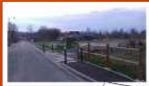
Rue du Montaigu