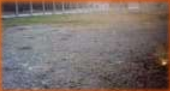
Aire de jeux