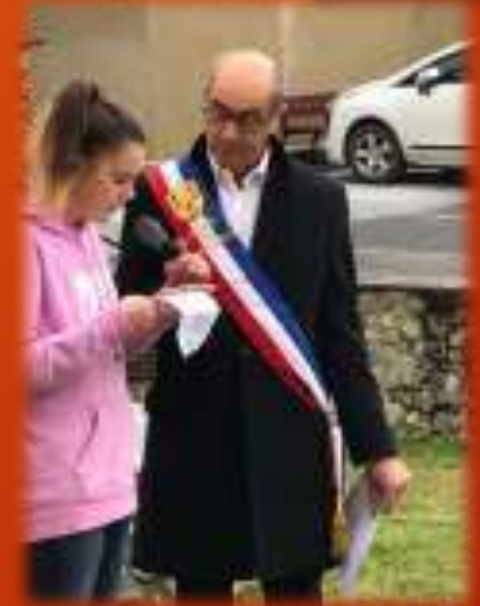
La cérémonie du 11 novembre, au nouveau monument aux morts

Ces dernières années, la fonction de maire dans un petit village a connu de profondes transformations avec la généralisation de l'informatique et du numérique qui impose un travail d'adaptation permanent.