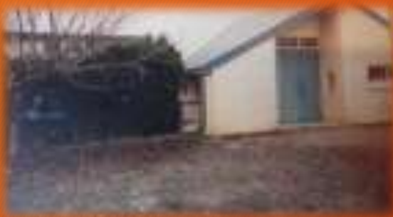
La salle des fêtes et la salle communale