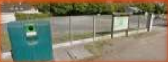
Colonne à verre