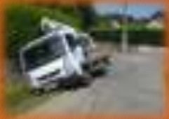
Rue de l'agriculture