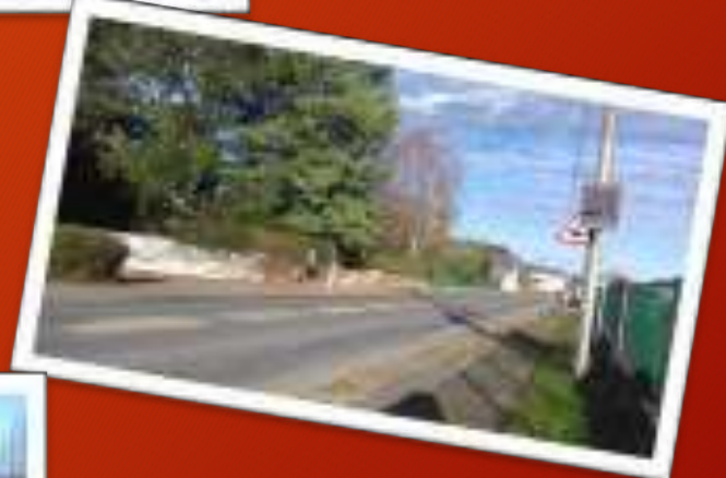
Rue des Pyrénées