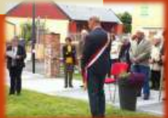
La cérémonie du 8 mai 45, au nouvel emplacement du monument aux morts