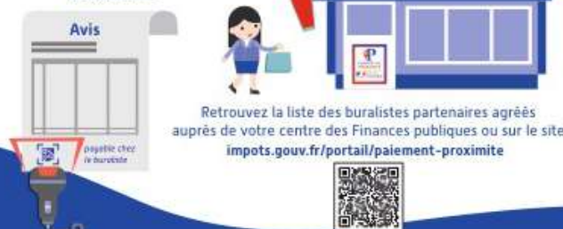
Illustration : G. L. / Illustration : G. L. / Illustration : G. L. / Illustration : G. L.

2 Rendez-vous chez votre buraliste avec votre facture, scannez et payez en toute sécurité