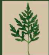
Feuille profondement découpée