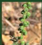
Fleurs mâles sur de longs épis