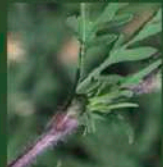
Tige velue et rougeâtre